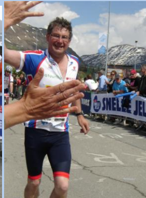
Jan. Drie keer 15 km is een marathon bergop gelopen.