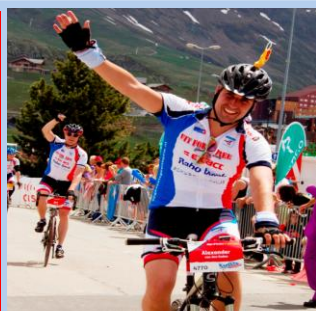
Alexander: "Je hebt pas alles gegeven, als je echt niet meer kunt!"